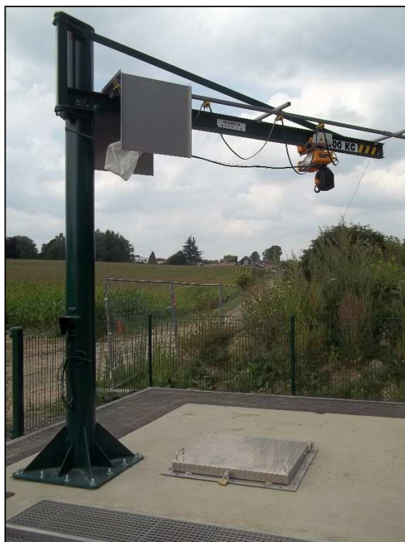
Potence fixe de manutention des équipements