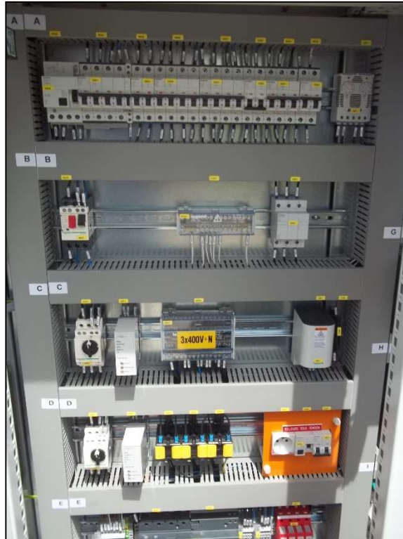
Vue TGBT - Puissance