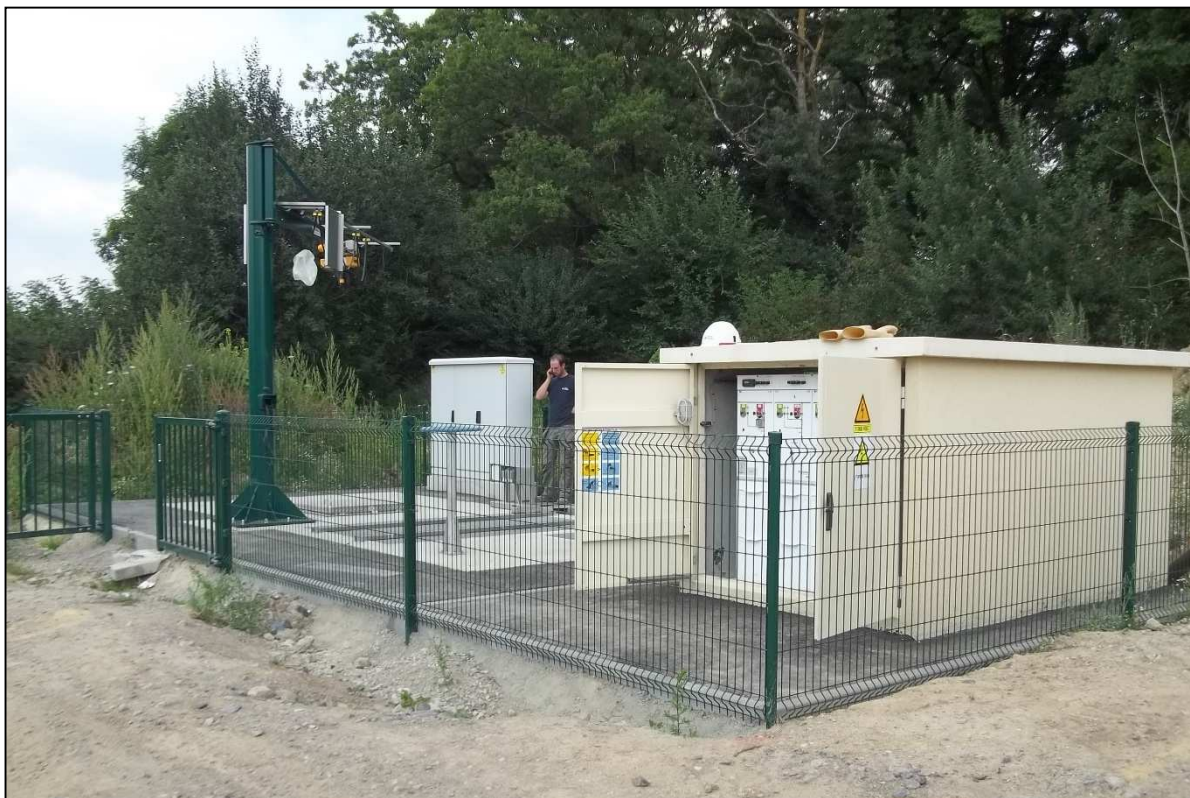
Vue générale de la station de relevage avec cabine HT en avant plan