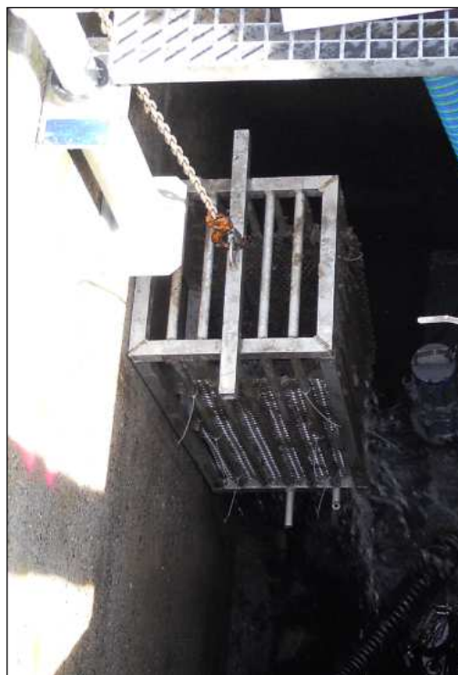
Panier de dégrillage

La bache de relevage était précédemment équipée d'un panier de dégrillage relevable. A l'entrée de cette station, les eaux usées sont particulièrement chargées de grosses particules (chaussettes, sachets plastique, serviettes hygiénique,...). Les roues des pompes de relevage se trouvaient donc régulièrement bloquées par des débris de gros diamètre.