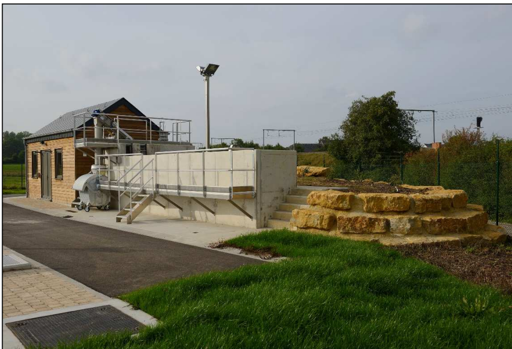
Vue du bâtiment technique et du prétraitement