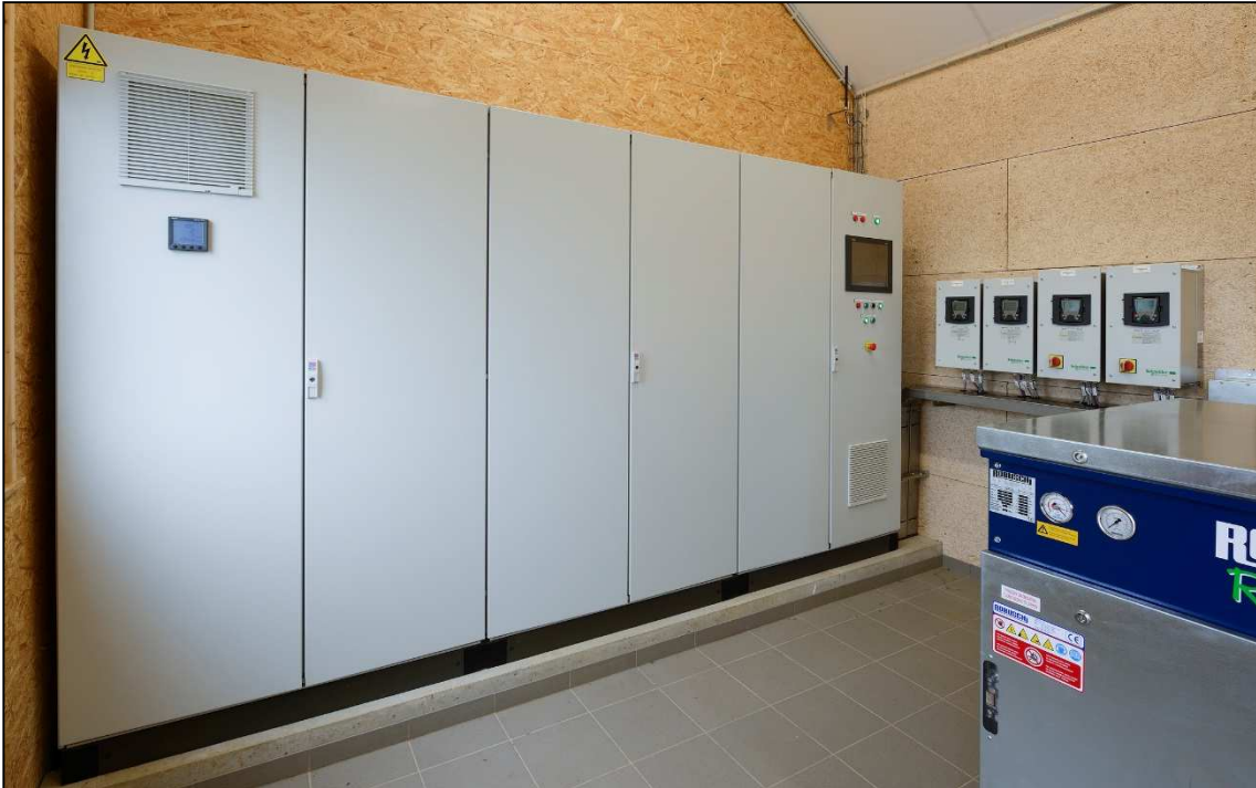
TGBT dans le local technique