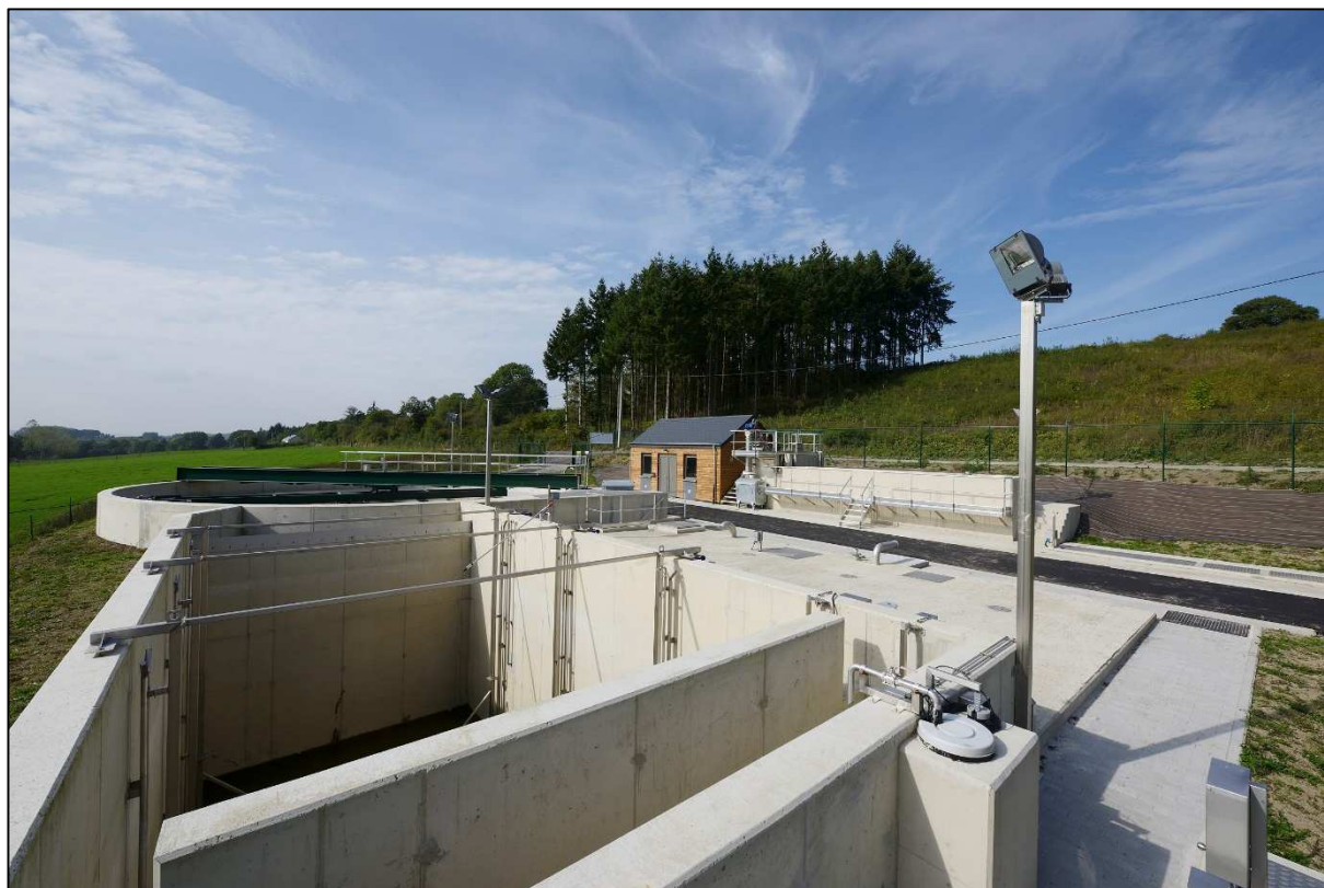
Vue générale de la station d'épuration depuis le bassin d'anoxie - aérobie