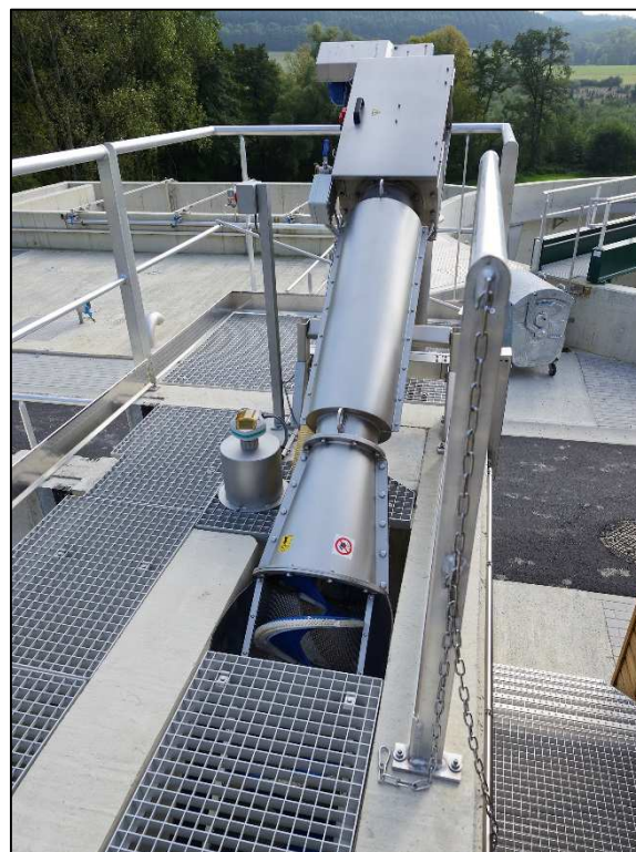
Prétraitement : dégrilleur fin type « tamis-press » et conteneur de stockage