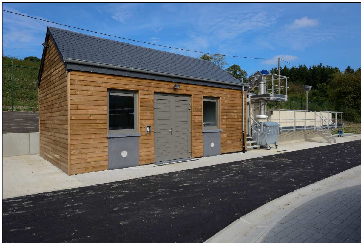
Bâtiment de service de la station d'épuration