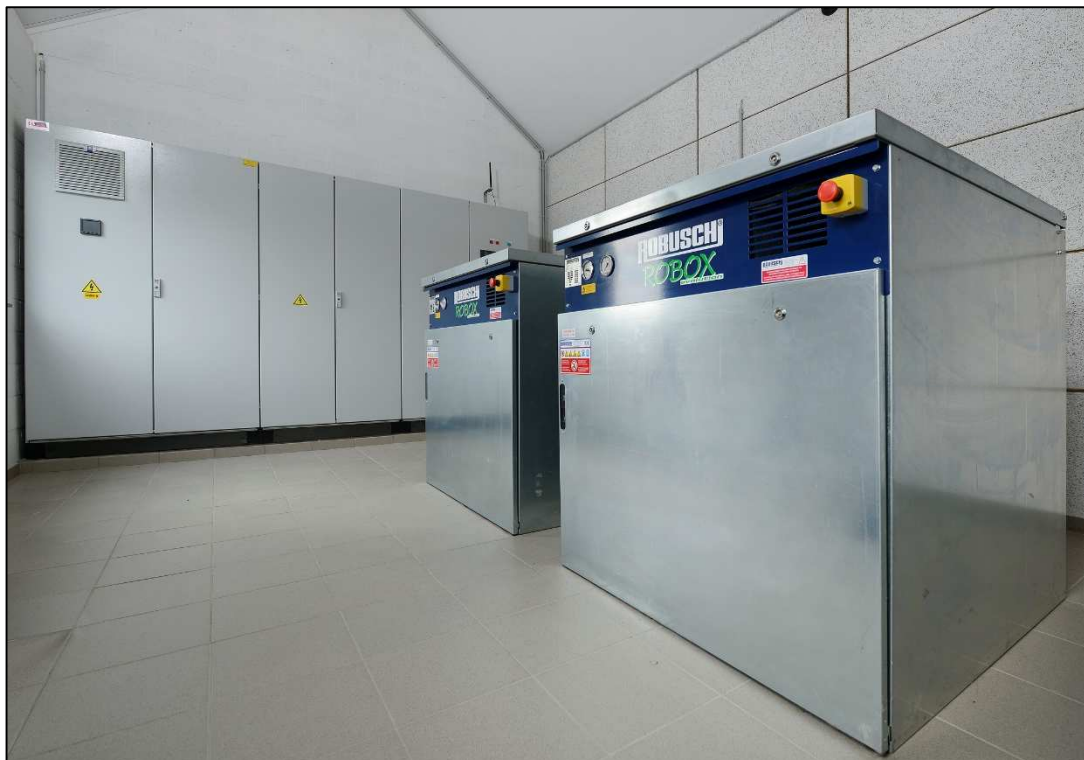
Surpresseurs d'aération et TGBT