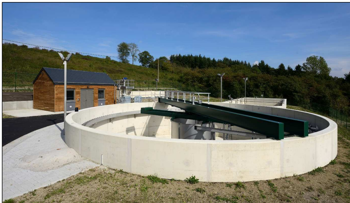
Vue générale de la station d'épuration depuis le clarificateur